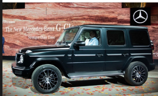
汽车 房地产 Automobile Real Estate