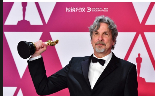
科技 娱乐 Technology Entertainment