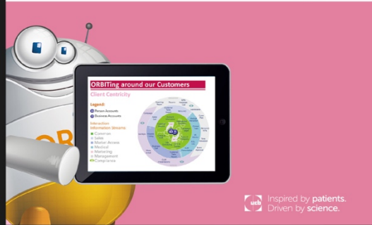
医药 大健康 Great Health Of Medicine