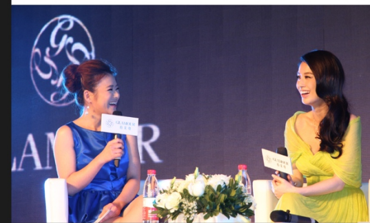
时尚 化妆品 Fashion Cosmetics