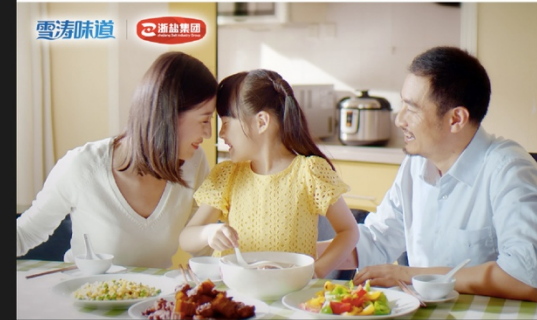
食品 快消品 Food Fast Food