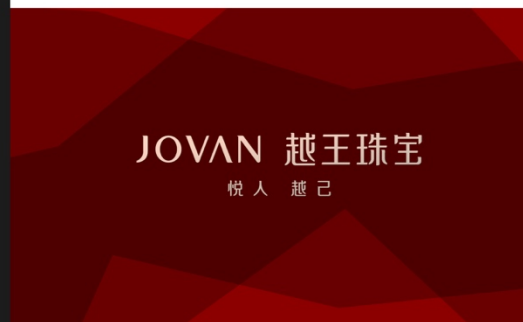
珠宝 奢侈品 Jewelry And Luxury