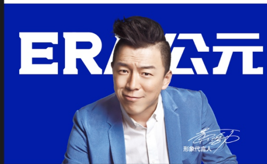
工业 新制造 New Industrial Manufacturing