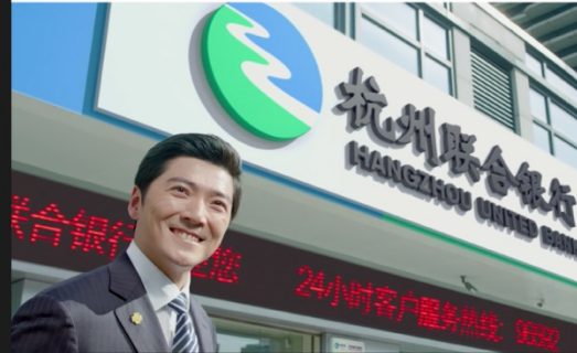
银行 新金融 New Banking Finance